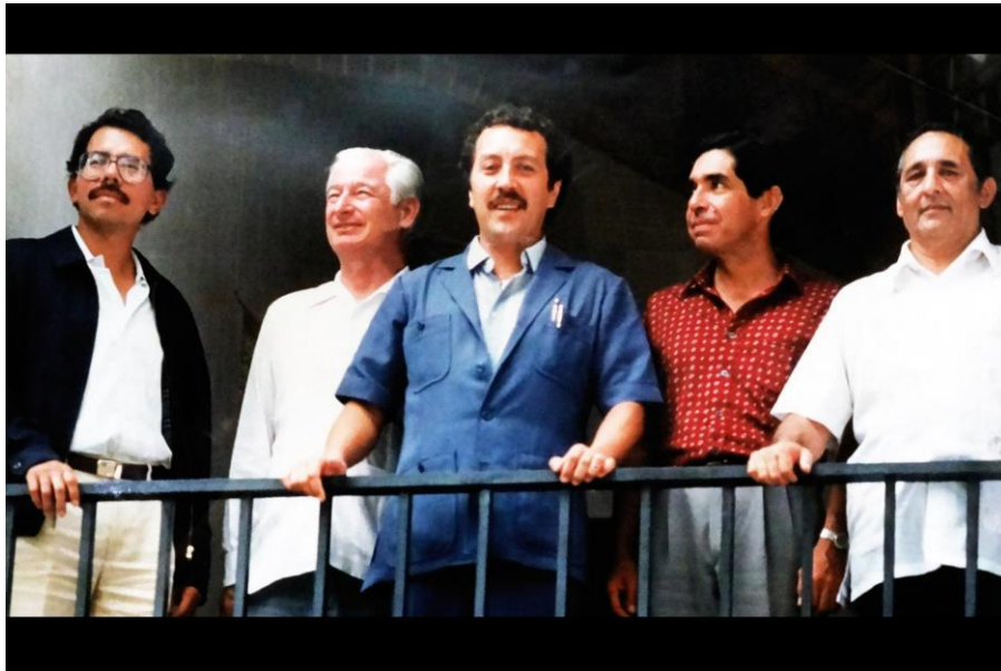
ESQUIPULAS I: Presidentes de Centroamérica Izq. A Der. Oscar Arias (Costa Rica), Napoleón Duarte (El Salvador), Vinicio Cerezo (Guatemala), José Azcona (Honduras) y Daniel Ortega (Nicaragua).